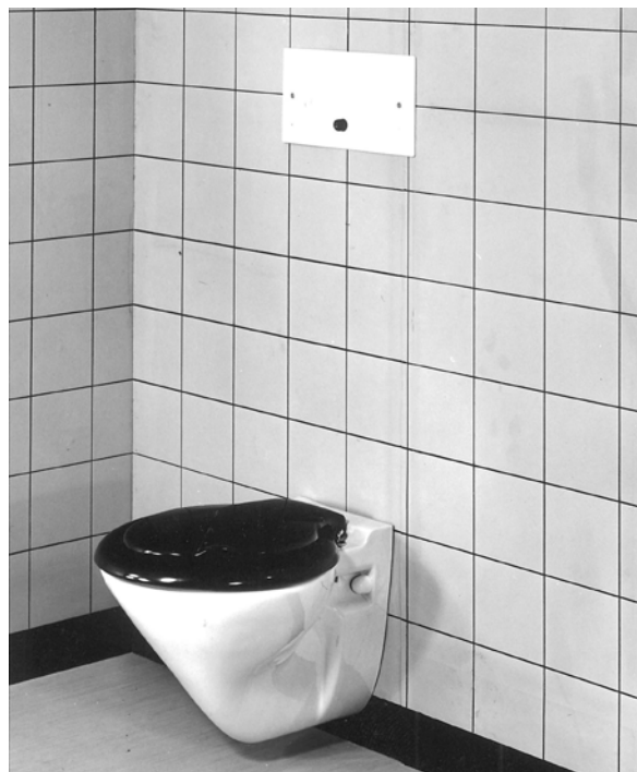
↑ La «Cisterna empotrada n.º 15.000» permite ganar espacio, ya que se instala dentro de la pared.

→ Hoy en día, las cisternas empotradas se instalan sobre todo con el bastidor Duofix azul.